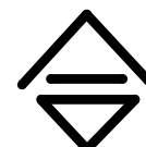
図 1 基準器検査証印

東京都が実施している基準器検査は、長さ（タクシーメーター装置検査用基準器）、質量（基準はかり、基準分銅）、面積（基準面積板）及び体積（基準ガスメーター、液体メーター用基準タンク）で、最近 3 年間の検査実績は第 1 表、有効期間は第 2 表のとおりである。