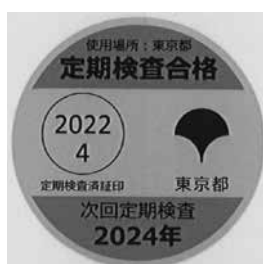
《定期検査済証印が付された貼付け印》

都知事の権限で実施する定期検査以外に、法第19条第2項により、法第127条第1項の適正計量管理事業所の指定を受けた者は、経済産業省令で定める計量士に検査させなければならない。