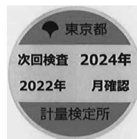
《次回検査時期周知用シール》